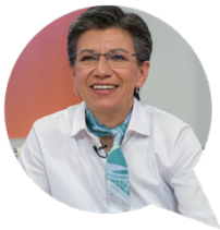
Claudia Nayibe López Hernández

Los invitamos a conocer el resultado de este maravilloso trabajo a través de este informe y a consultar en la página www.misioneducadores.educacionbogota.edu.co . Esperamos que este aporte a la educación de la ciudad sea significativo y contribuya a la toma de decisiones durante los próximos años, para que entre todos continuemos siempre poniendo a la educación en el primer lugar de la agenda pública de Bogotá.